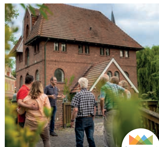
Stadsrondleiding in Schüttorf