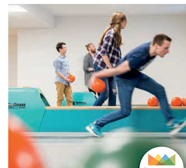
moveINN – ÜbernachtungsSportErlebnisWelt