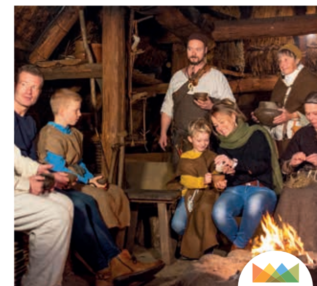
Boerderij uit de bronstijd in Uelsen